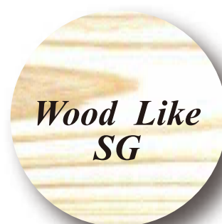
Wood Like SG