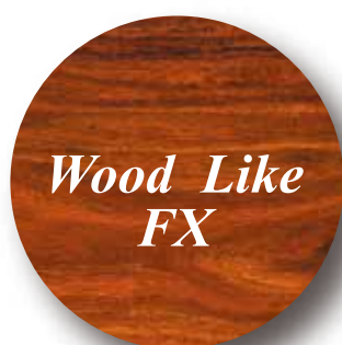
Wood Like FX