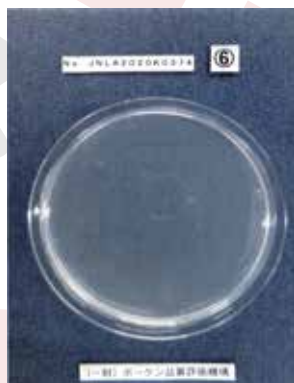
バイオワルツトップ NY-100 24時間後

試験機関：一般財団法人ボークン品質評価機構 試験方法：JIS Z2801 抗菌加工製品 抗菌・抗菌性試験方法・抗菌効果 抗菌前処理方法：耐水処理（区分1）、耐光処理（区分1） （抗菌製品技術協議会持続性基準）