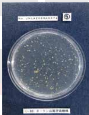
一般ウレタン 24時間後