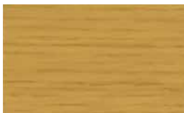
ナチュラルブラウン