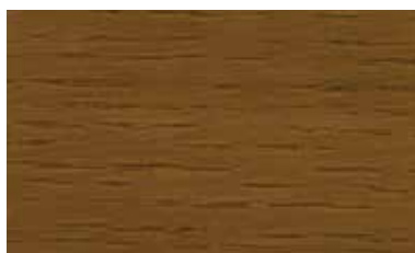
ミディアムブラウン