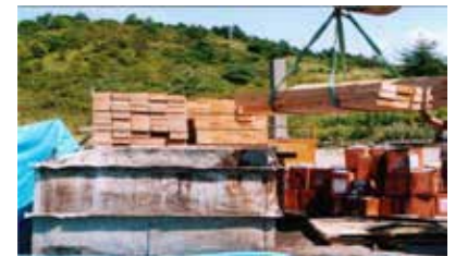
ディッピング塗装